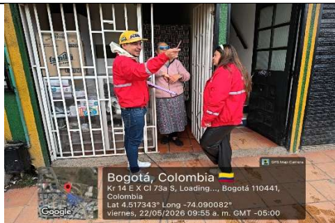
FOTOGRAFIA 3. SENSIBILIZACIÓN AL COMERCIO