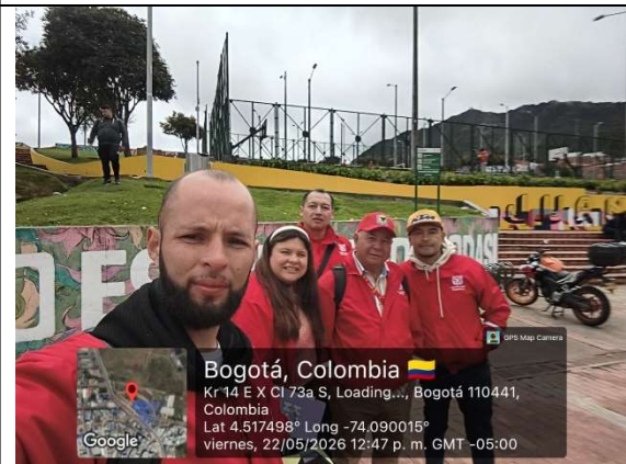
FOTOGRAFIA 6. FINALIZACIÓN DE LA SENSIBILIZACIÓN

CONSOLIDACIÓN DE DATOS: En la jornada se realizaron un total de 42 sensibilizaciones, 28 personas que viven en la comunidad y 14 comercios de la zona.