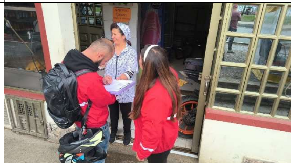
FOTOGRAFIA 4. SENSIBILIZACIÓN A LA COMUNIDAD