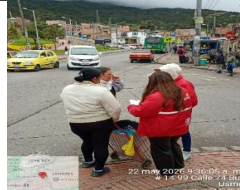
FOTOGRAFIA 2. SENSIBILIZACIÓN A LA COMUNIDAD