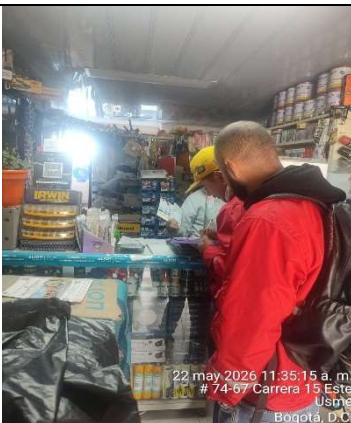
FOTOGRAFIA 5. SENSIBILIZACIÓN AL COMERCIO