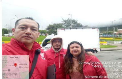
FOTOGRAFIA 1. INICIO SENSIBILIZACIÓN